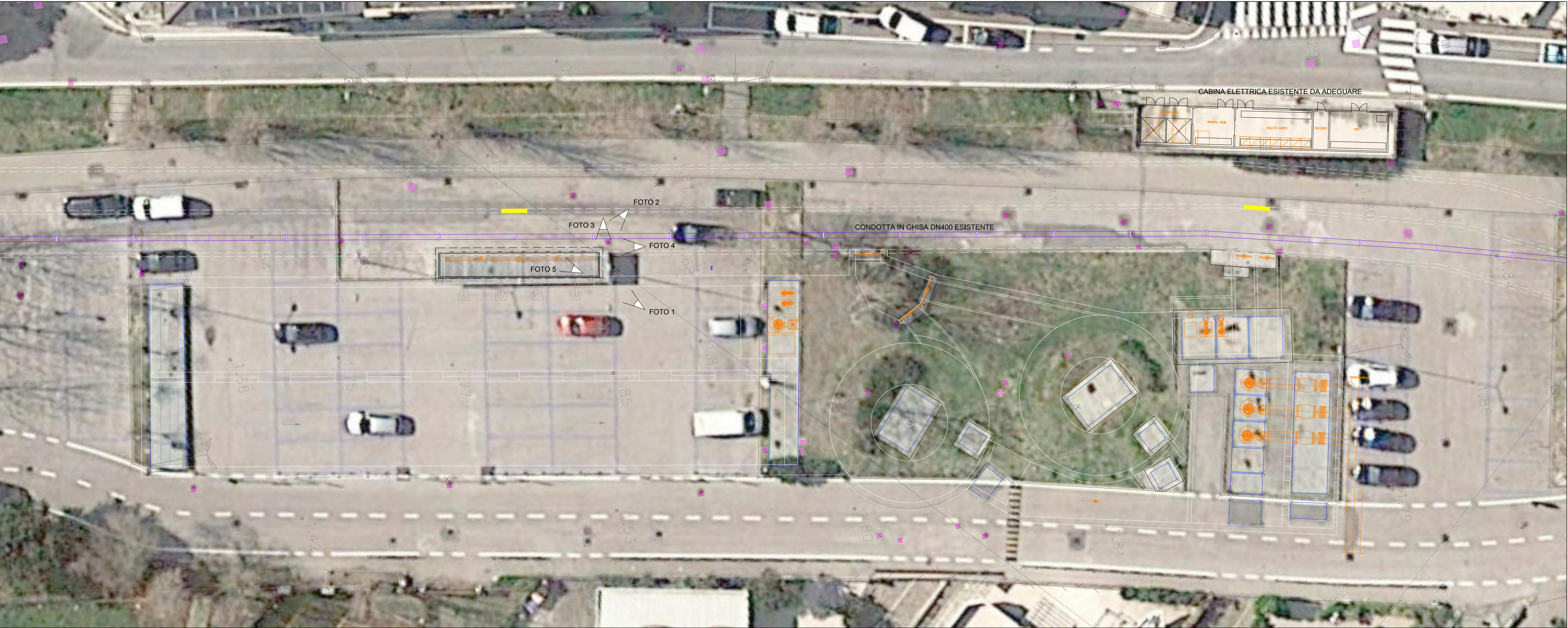
PLANIMETRIA STATO DI FATTO CON DEMOLIZIONI scala 1:200